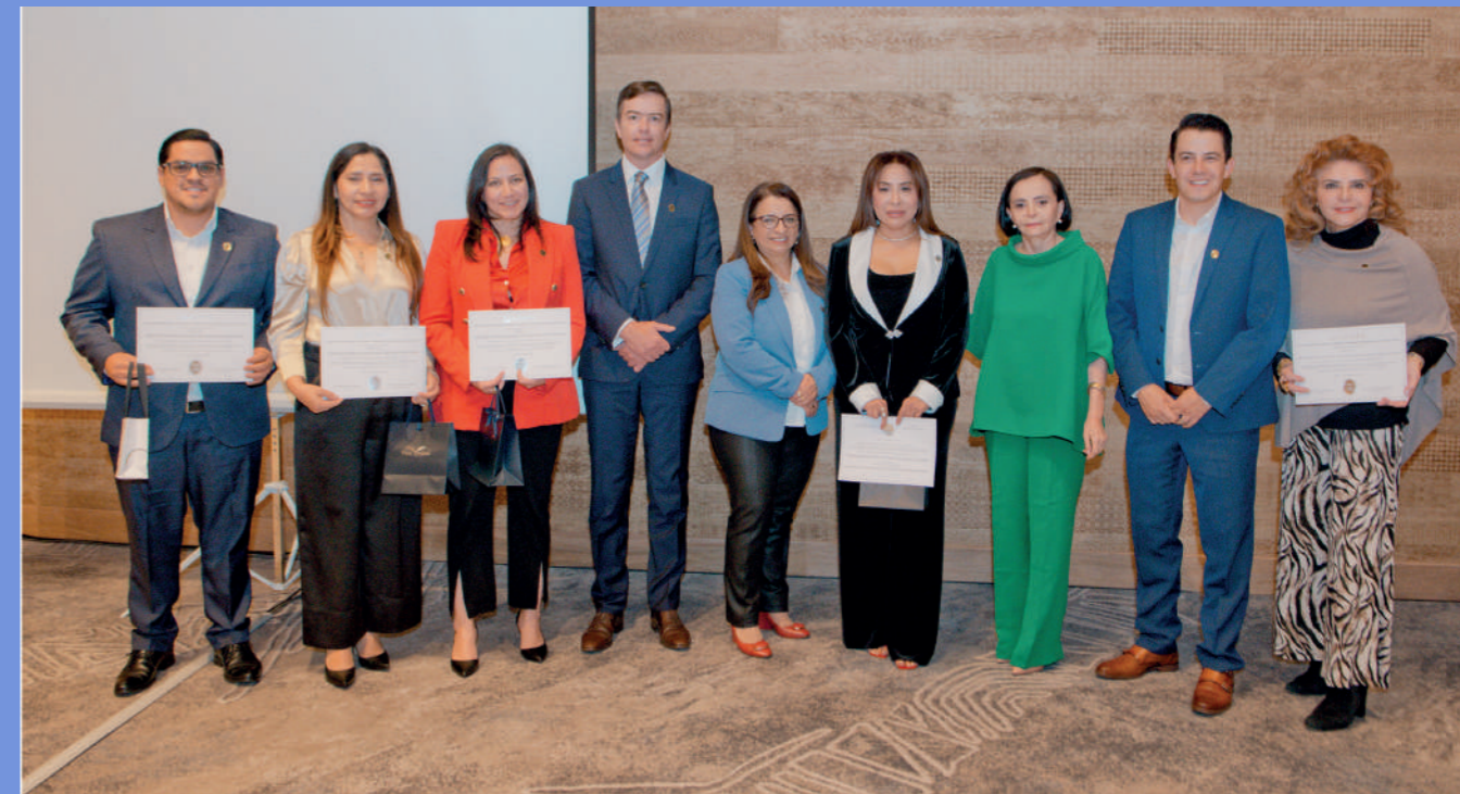
Los integrantes del Comité Ejecutivo de ACHPE entregaron los reconocimientos a los representantes de los Centros Especializados de Diálisis de Guayaquil.