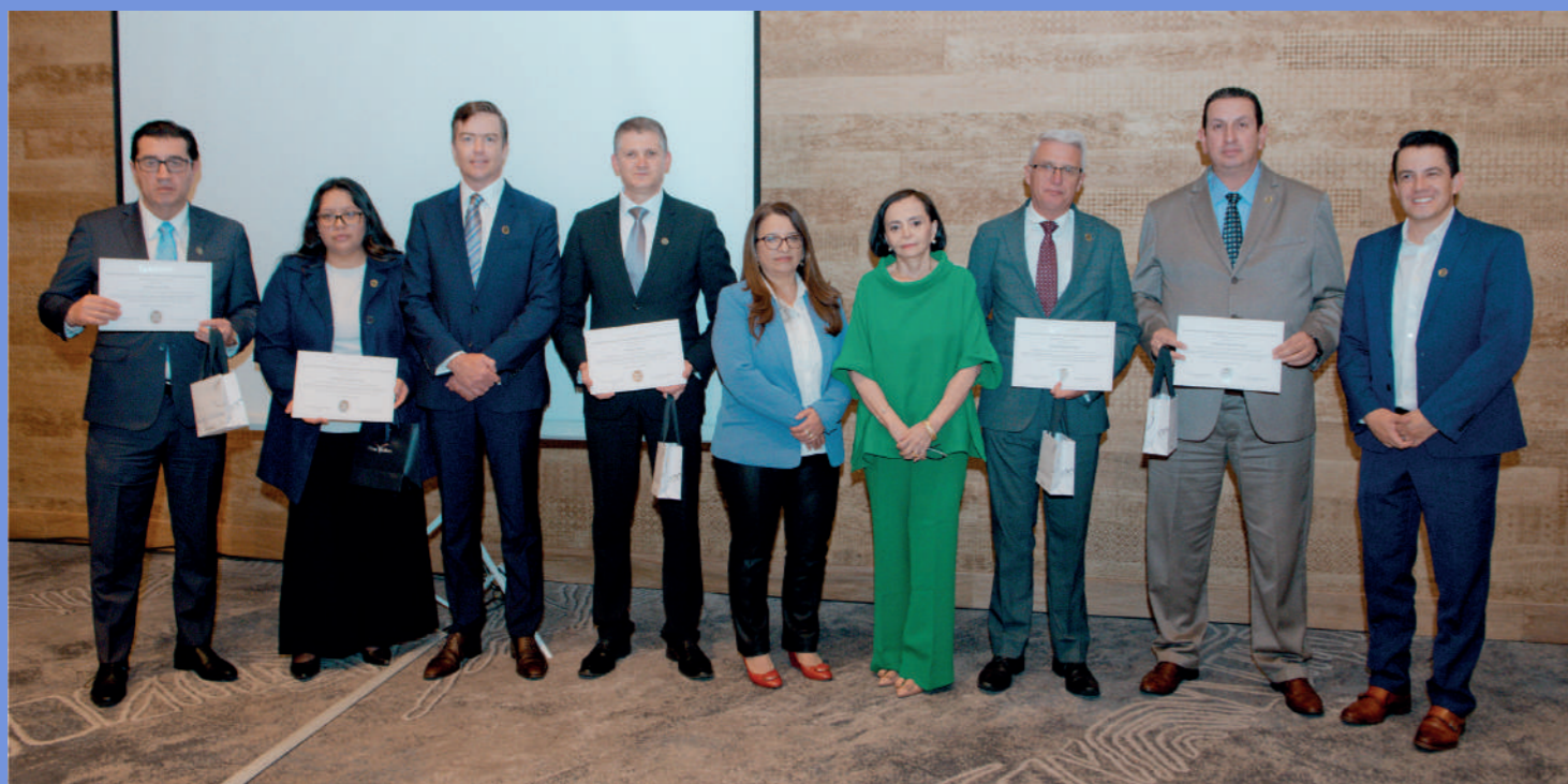
Los representantes de las clínicas y hospitales de Cuenca recibieron los reconocimientos de parte de los miembros del Comité Ejecutivo de ACHPE.