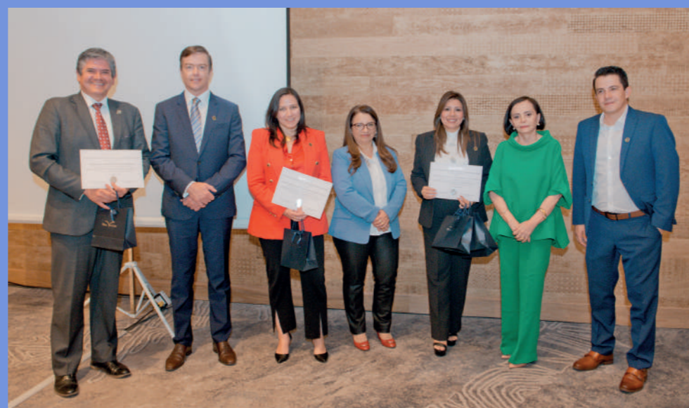
Los representantes de los Centros Especializados de Diálisis de Quito recibieron los reconocimientos del Comité Ejecutivo de ACHPE.