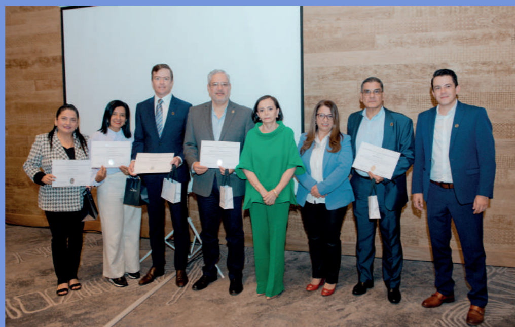
Los integrantes del Comité Ejecutivo de ACHPE entregaron los reconocimientos a los representantes de las clínicas y hospitales de Guayaquil.