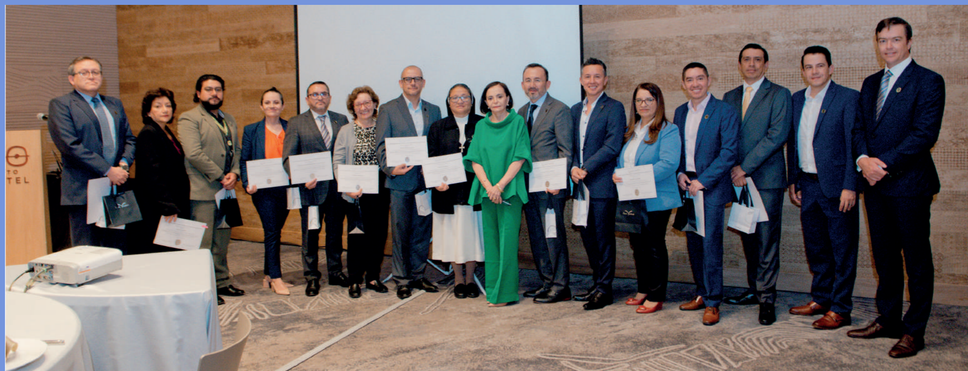
Los miembros del Comité Ejecutivo de ACHPE entregaron los reconocimientos a los representantes de las clínicas y hospitales de Quito.

El diploma que recibió cada institución estaba personalizado con el año en que cada una se unió a ACHPE.