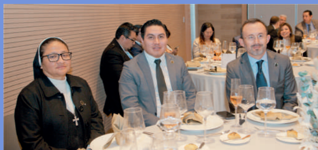
Socios de ACHPE de la ciudad de Quito.

Las siete instituciones fundadoras son: Clínica Pasteur, Novaclínica Santa Cecilia, Hospital Metropolitano, Clínica de la Mujer, Clínica Internacional, Clínica El Batán Del Pozo y Hospital Vozandes. Todas ellas están activas en el gremio hasta la actualidad.