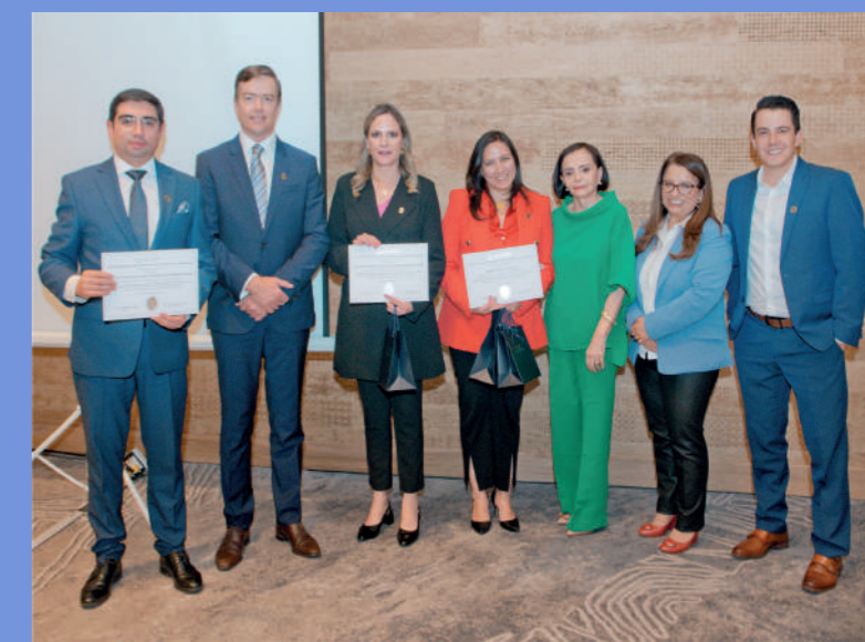
El Comité Ejecutivo de ACHPE entregó los reconocimientos a los Centros Especializados de Diálisis de Manta.