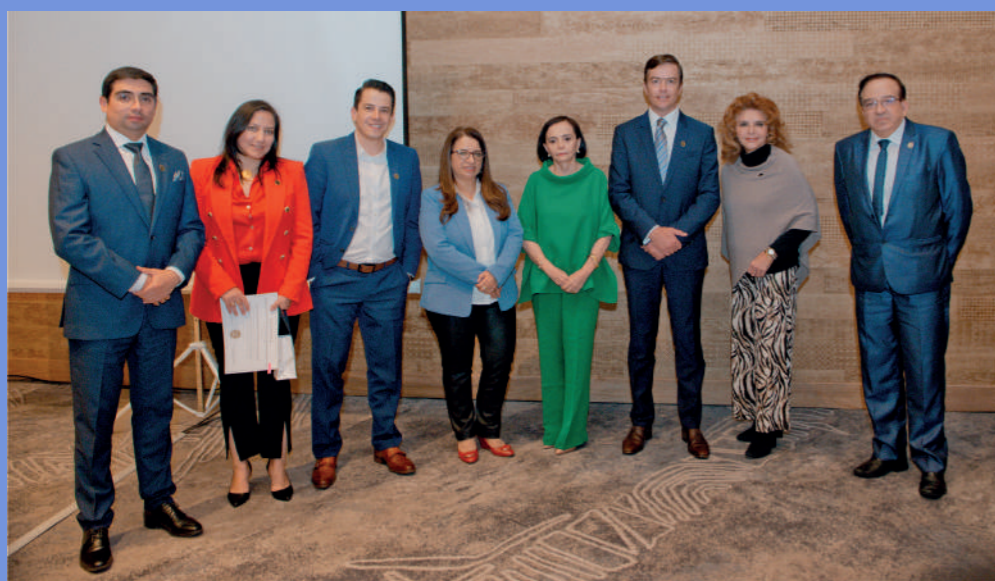
El Comité Ejecutivo de ACHPE entregó los reconocimientos a los representantes de los Centros Especializados de Diálisis de Ibarra y Esmeraldas.