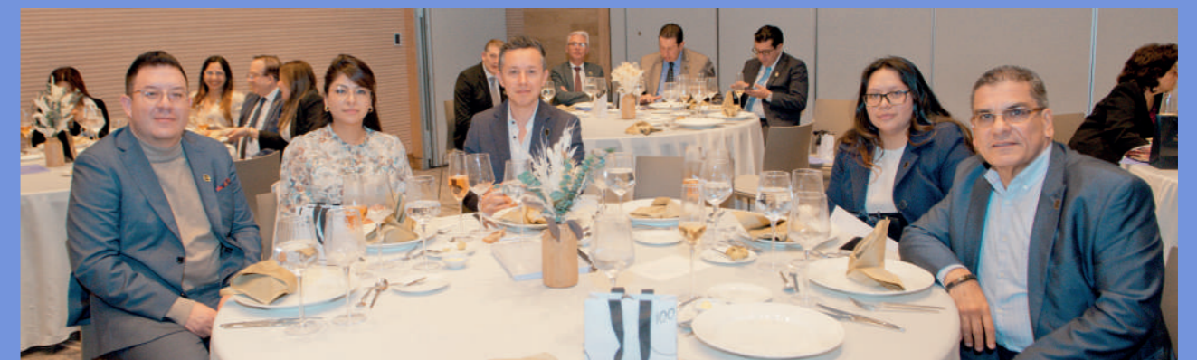
Miembros de ACHPE de las clínicas y hospitales de Quito, Guayaquil y Cuenca.

El Vicepresidente gremial también resaltó el orgullo mutuo y generalizado de pertenecer a una noble institución como ACHPE y de tener destacados agremiados. Finalmente, expresó el deseo de alcanzar un futuro de éxito y larga vida para la asociación y sus miembros.