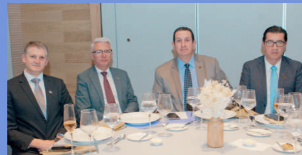
Miembros de ACHPE de la ciudad de Cuenca.